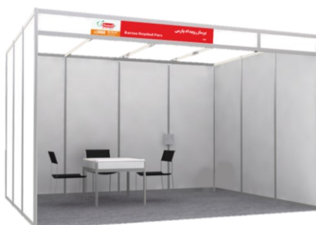
شکل ۱- نمونه غرفه بندی استاندارد با پانل (اکتانورم)

این نوع از سازه ها که در فضاهای داخلی و سالن های نمایشگاهی کاربرد دارند، شامل پانل هایی در ابعاد ۲۷۰*۱۰۰ سانتی متر بوده که دیوارها را شامل می شوند. سر درب غرفه نیز مطابق شکل ۱ کتیبه نام شرکت نصب می شود.